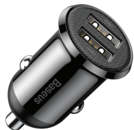
Baseus Grain Pro car charger 2x USB 4.8 A black